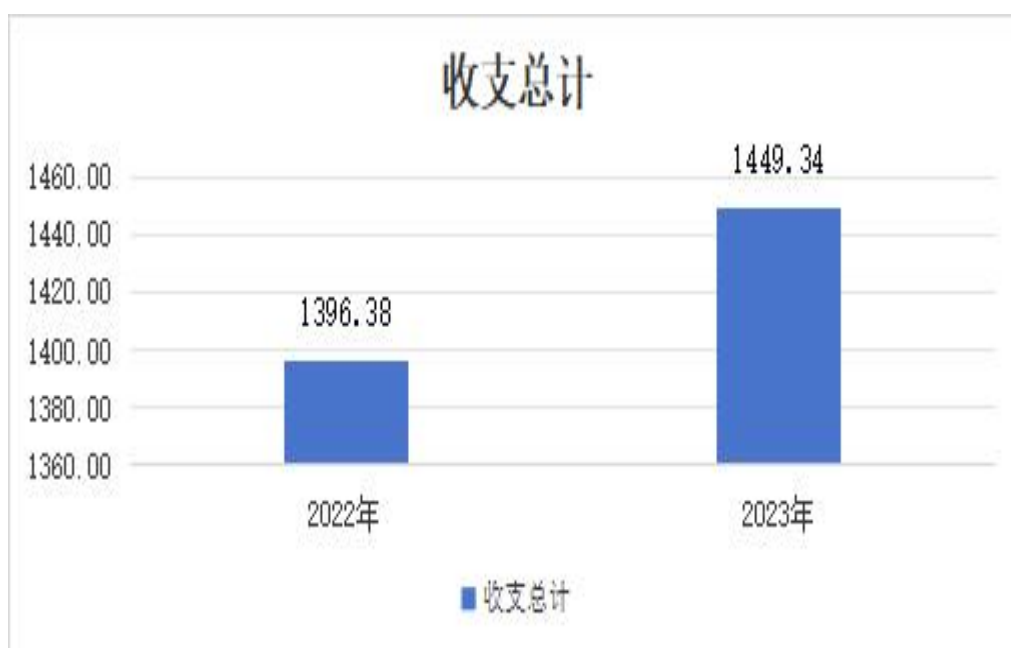
(图 1: 收、支决算总计变动情况图) (柱状图)

2023 年度收、支总计均为 1449.34 万元。与 2022 年度相比，收、支总计各增加 52.96 万元，增长 3.79%。主要变动原因是新增聘用人员 15 人。