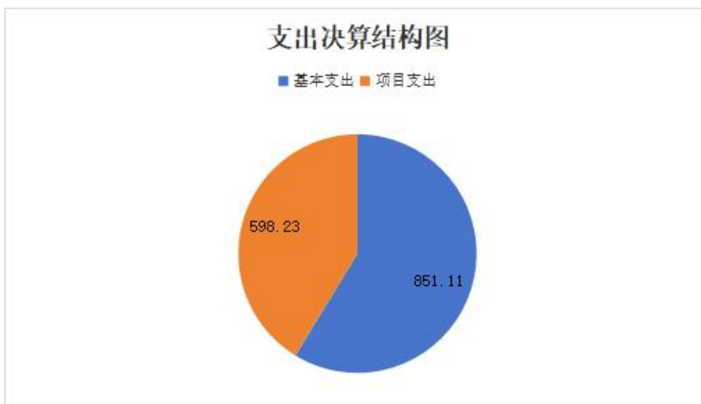
(图 3: 支出决算结构图) (饼状图)

2023 年度本年支出合计 1449.34 万元，其中：基本支出 851.11 万元，占 58.72%；项目支出 598.23 万元，占 41.27%；上缴上级支出 0 万元，占 0%；经营支出 0 万元，占 0%；对附属单位补助支出 0 万元，占 0%。