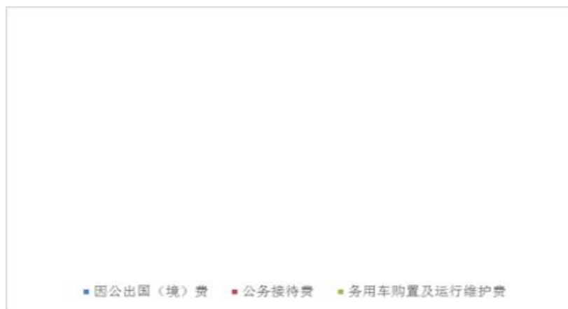
（图 7：“三公”经费财政拨款支出结构）（饼状图）

2023 年度“三公”经费财政拨款支出决算中，因公出国（境）费支出决算 0 万元，占 0%；公务用车购置及运行维护费支出决算 0 万元，占 0%；公务接待费支出决算 0 万元，占 0%。具体情况如下：