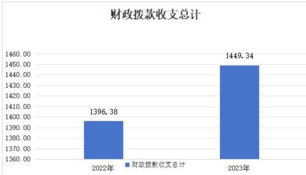
（图 4：财政拨款收、支决算总计变动情况）（柱状图）

2022 年度相比，财政拨款收、支总计各增加 52.96 万元，增长 3.79%。主要变动原因是新增聘用人员 15 人。