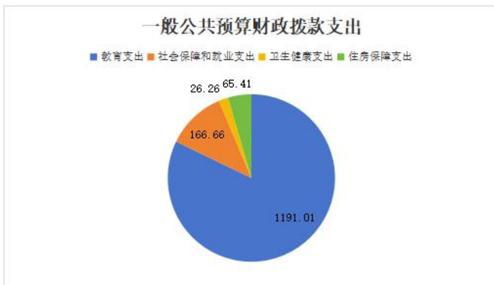
（图 6：一般公共预算财政拨款支出决算结构）

2023 年度一般公共预算财政拨款支出 1449.34 万元，主要用于以下方面：教育支出 1191.01 万元，占 82.18%；社会保障和就业支出 166.66 万元，占 11.5%；卫生健康支出 26.26 万元，占 1.81%；住房保障支出 65.41 万元，占 4.51%。