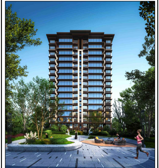
调整前透视效果图