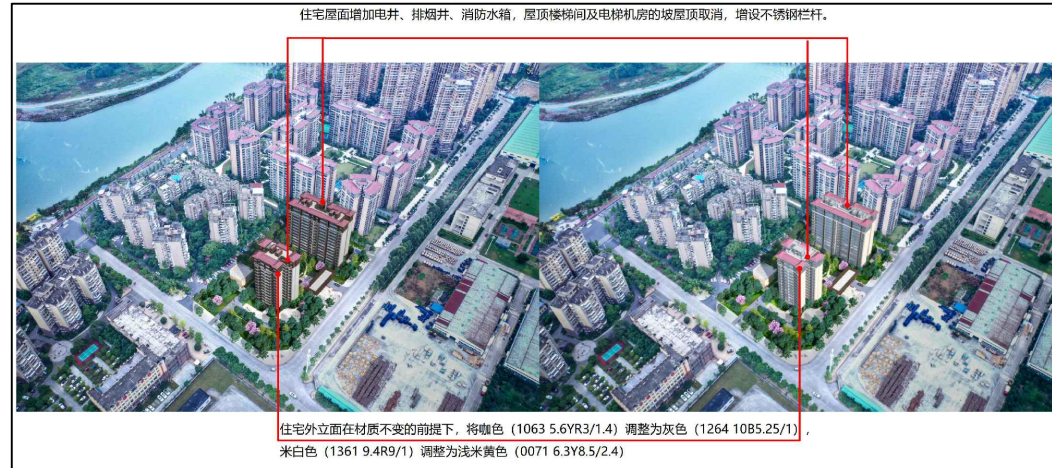
实景鸟瞰效果图调整对比