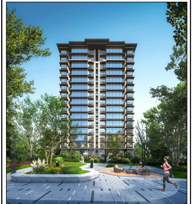
调整后透视效果图