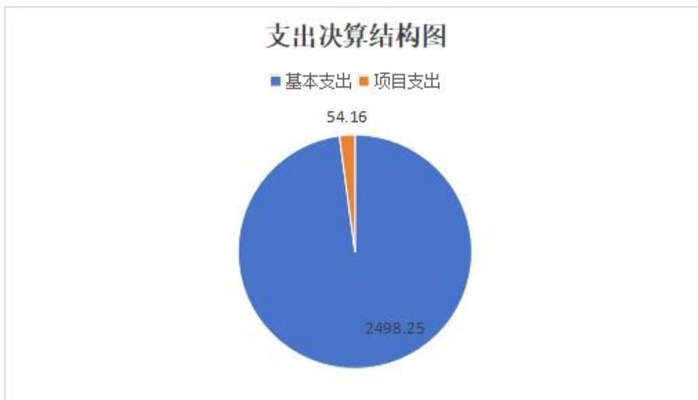
(图 3: 支出决算结构图) (饼状图)

2023 年度本年支出合计 2552.41 万元，其中：基本支出 2498.25 万元，占 97.87%；项目支出 54.16 万元，占 2.12%；上缴上级支出 0 万元，占 0%；经营支出 0 万元，占 0%；对附属单位补助支出 0 万元，占 0%。