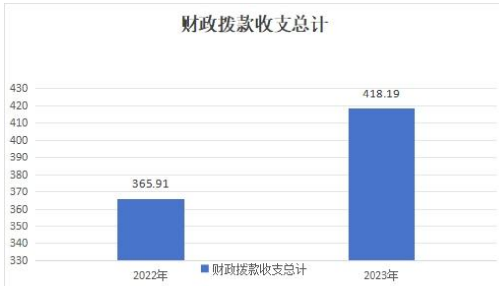
(图 4: 财政拨款收、支决算总计变动情况)(柱状图)

年度相比，财政拨款收、支总计各增加 52.28 万元，增长 14.29%。主要变动原因是 2023 年新增在职人员 3 人。