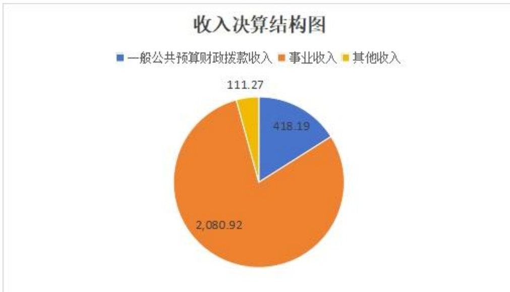
(图 2: 收入决算结构图) (饼状图)