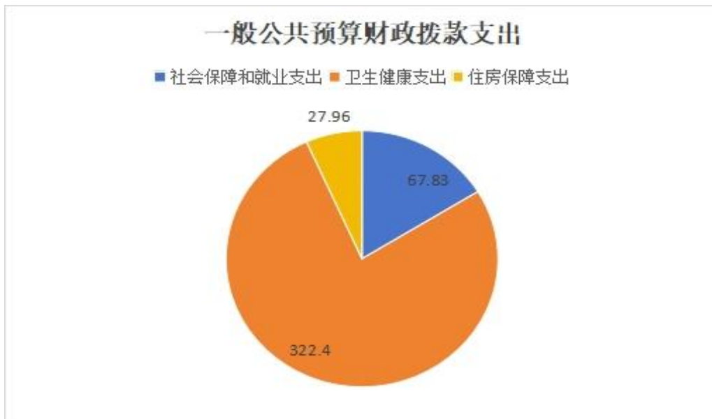
(图 6: 一般公共预算财政拨款支出决算结构)(饼状图)

2023 年度一般公共预算财政拨款支出 418.19 万元，主要用于以下方面：社会保障和就业支出 67.83 万元，占 16.22%；卫生健康支出 322.40 万元，占 77.09%；住房保障支出 27.96 万元，占 6.69%。