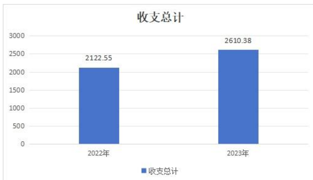
(图 1: 收、支决算总计变动情况图)(柱状图)

2023 年度收、支总计均为 2610.38 万元。与 2022 年度相比，收、支总计各增加 487.83 万元，增长 22.98%。主要变动原因是医疗收入增加及公共卫生收入增加。